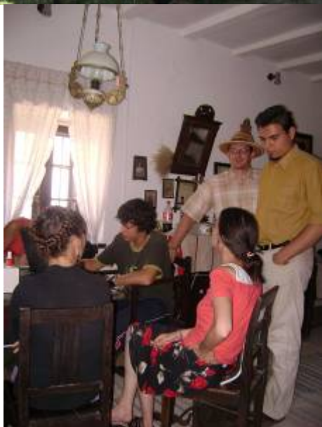
Akció közben a leltározó kommandó